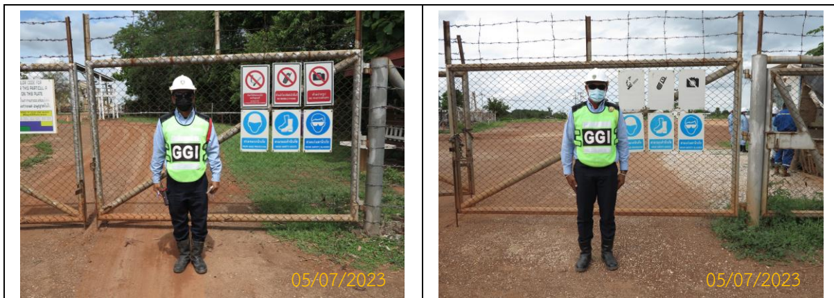
ภาพที่ 2.2-5 เจ้าหน้าที่รักษาความปลอดภัยประจำฐานหลุมผลิต