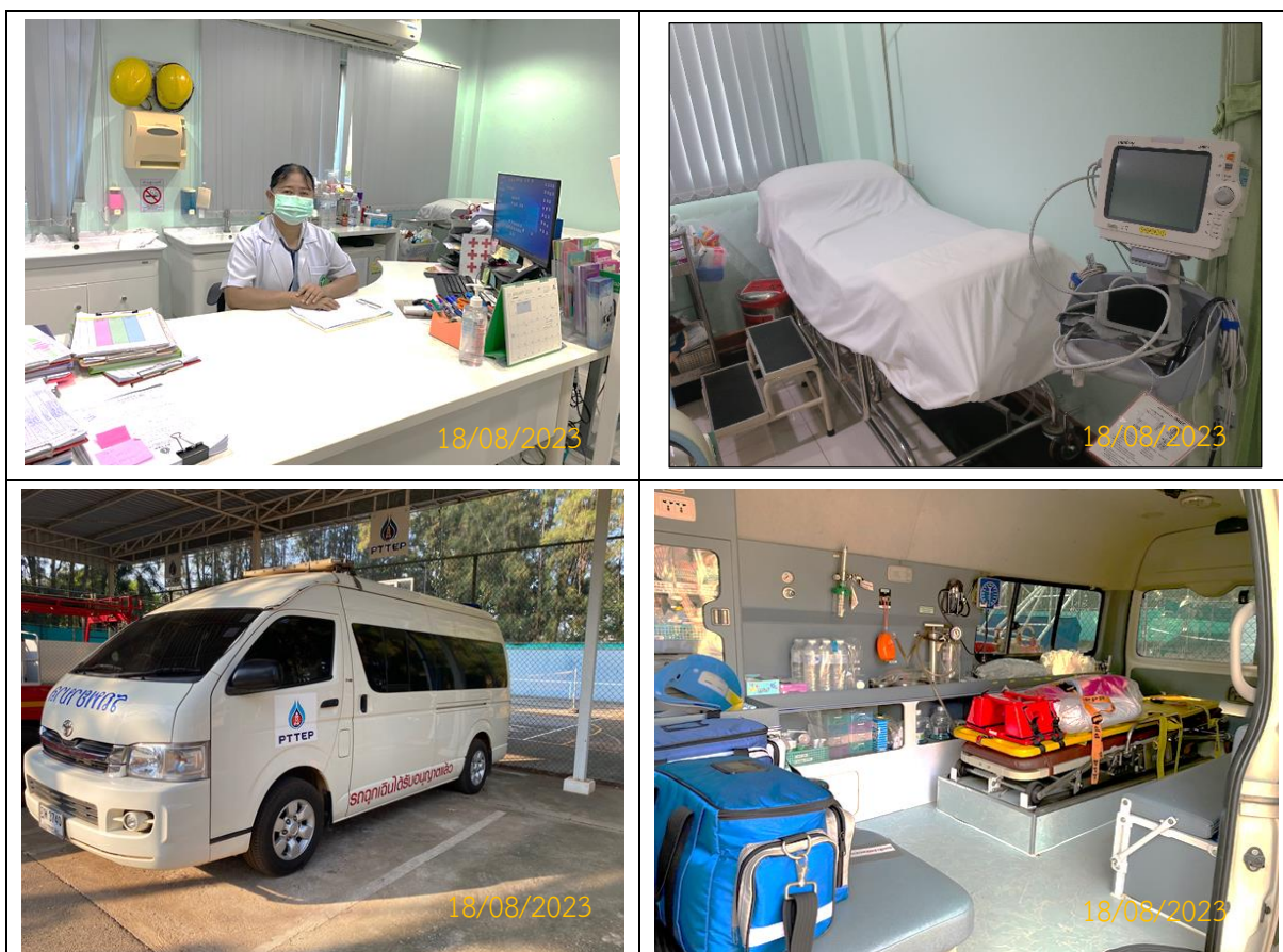
ภาพที่ 2.2-6 เจ้าหน้าที่ทางการแพทย์ ห้องพยาบาล และรถพยาบาลที่สถานีผลิตลานกระบือ (F/STN)