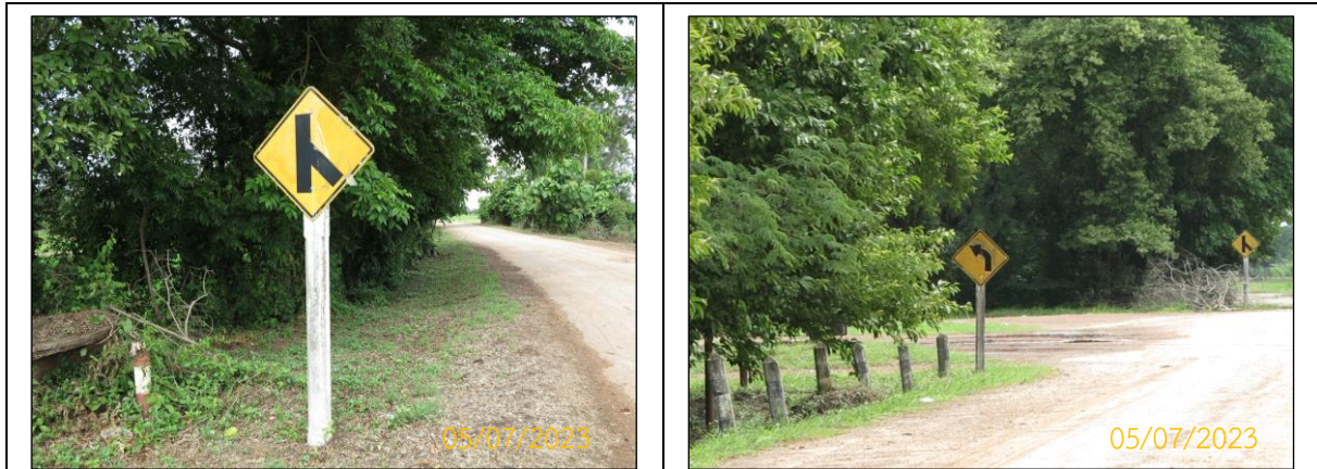
ภาพที่ 2.3-1 ป้ายสัญลักษณ์และป้ายเตือนจราจร