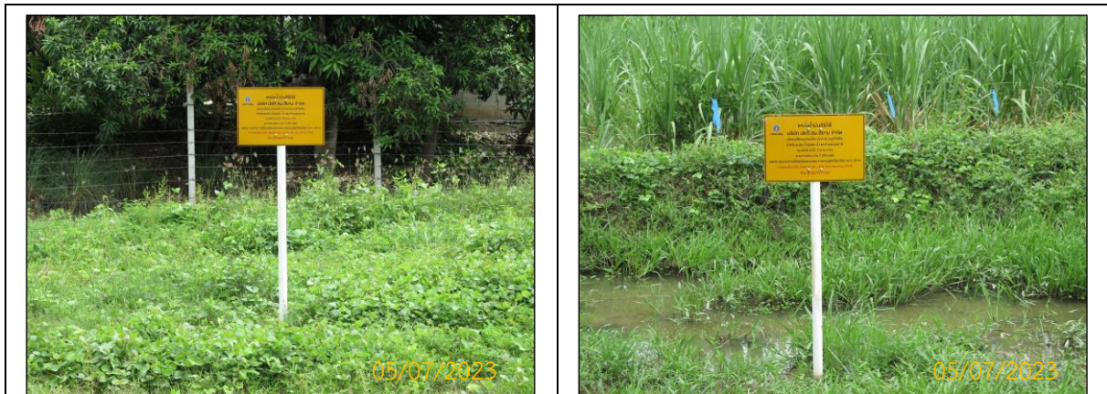
ภาพที่ 2.3-2 ป้ายเตือนสะท้อนแสงแสดงตำแหน่งแนววางท่อ