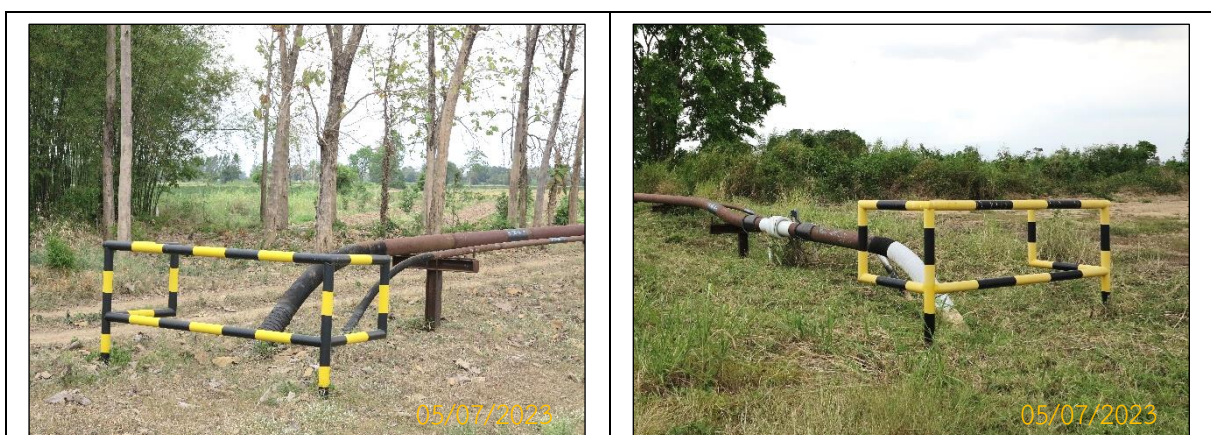
ภาพที่ 2.3-3 รั้วกันชนแนวท่อ